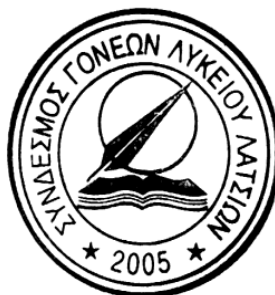
Άννα-Μαρία Χριστοδούλου Γραμματέας Δ.Σ.